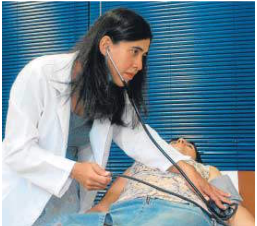
Una paciente durante una consulta con el ginecólogo.

La Asociación Europea de Cáncer Cervical aboga por la